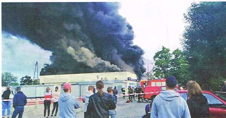
Pożar pawilonu PSS Społem w sierpniu 2021 r.

Istnieją spore szanse na to, że nowy pawilon zostanie otwarty w drugiej połowie przyszłego roku. Budynek będzie piętrowy; powierzchnię na parterze zajmie PSS Społem, a na piętrze planowana jest galeria handlowa oraz restauracja i kawiarnia.