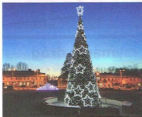
Świąteczny Plac Jana Pawła, foto: D. Redlicki

W 2020 roku LUX MED będzie kontynuować akcję bezpłatnych badań mammograficznych dla Pań w wieku 50-69 lat. Badania wykonywane są w ramach Programu Profilaktyki Raka Piersi finansowanego przez NFZ i nie wymagają skierowania lekarskiego.