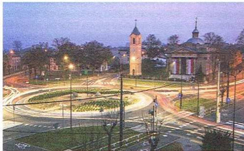
Rondo 100-lecia Odzyskania Niepodległości