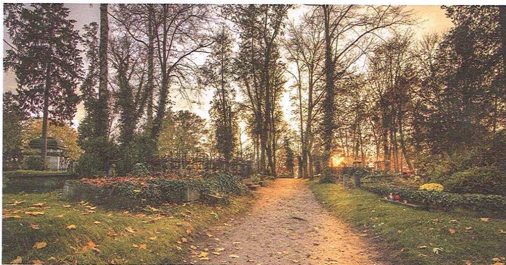
Cmentarz Ewangelicko-Augsburski