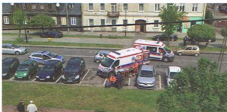
Wypadek na Wyszyńskiego