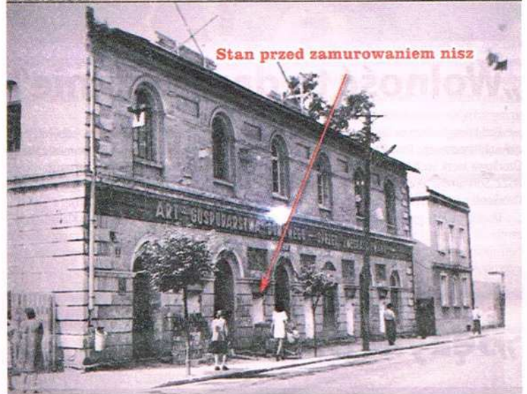
Stan przed zamurowaniem niszy