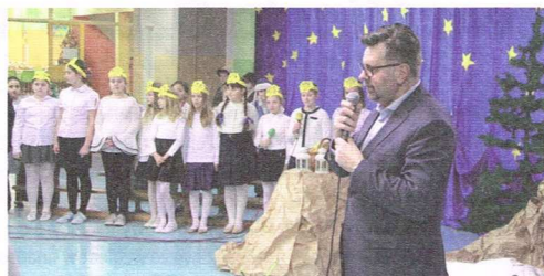
Wspólne kołędowanie w Młodzieżowym Domu Kultury im. Małego Księcia (foto ID)