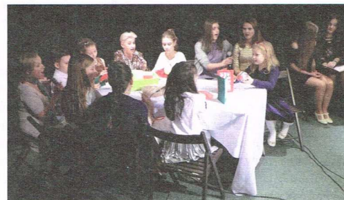
Wigilia w siedzibie Polskiego Stowarzyszenia Ludzi Cierpiących na Padaczkę