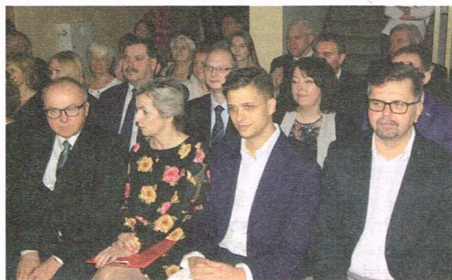
Spotkanie wigilijne w Zespole Szkół Specjalnych (foto ID)

Integralną częścią takich spotkań, organizowanych przez placówki kulturalne i oświatowe, są jasełka przygotowane przez dzieci i młodzież, a następnie składanie życzeń, dzielenie się opłatkiem i kosztowanie wigilijnych potraw.