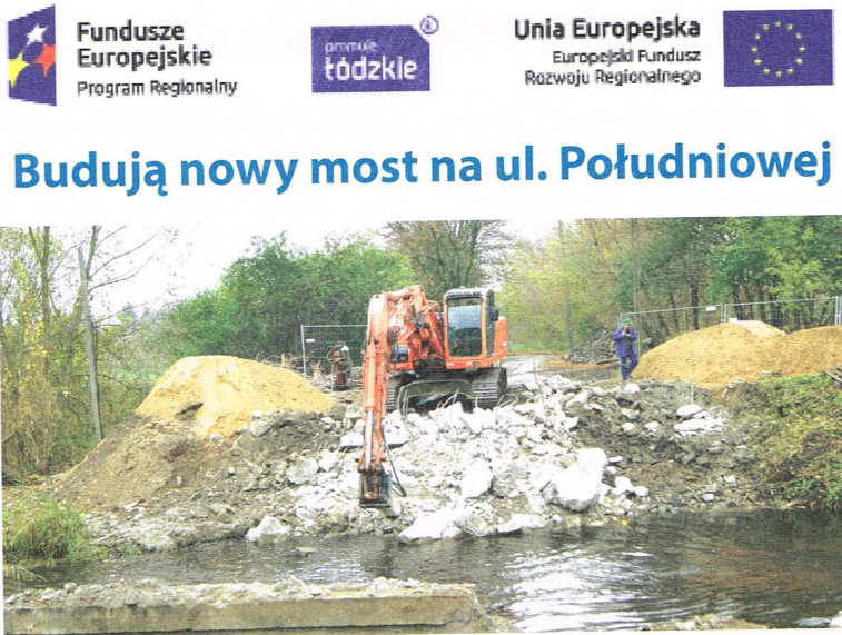
Prace rozbiórkowe starego mostu

Na ul. Południowej nie ma już starego mostu; został w tym tygodniu rozebrany i rozpoczęły się prace przy stawianiu nowego. Obecnie trwa tzw. palowanie, czyli wbijanie 38 żelbetonowych pali, na których następnie zostaną osadzone inne elementy, m.in. 14 belek nośnych, z których każda waży 24 tony.