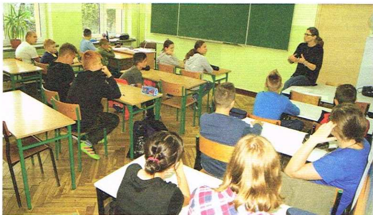
sala w SP5 przeznaczona na pracownię fiz.-chem.

Po raz pierwszy od roku 1999 w szkołach podstawowych pojawili się uczniowie klas siódmych. W Ozorkowie w Szkole Podstawowej nr 4 działają dwie klasy siódme, w Szkole Podstawowej nr 2 z oddziałami gimnazjalnymi – dwie. SP4 i SP5, w odróżnieniu od przekształcanej z gimnazjum w podstawówkę SP2, nie wymagały podczas wakacji większych remontów, związanych z dostosowaniem budynków do wymo-