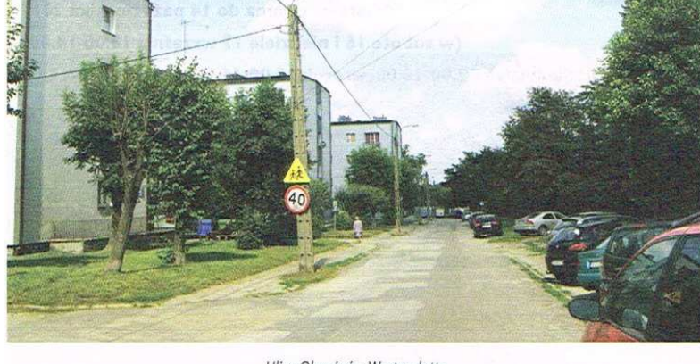
Ulica Obronców Westerplatte

Projekt dotyczy przebudowy chodnika po jednej stronie ulicy i wjazdów (od Berka Joselewicza) oraz prac pielęgnacyjnych zieleni ulicznej. Szacunkowy koszt – 85 tys. zł brutto .