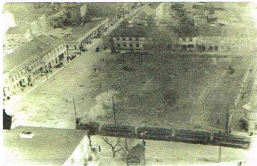
Widok na tramwaj przejeżdżający obok ratusza zgierskiego.

Współczesna komunikacja tramwajowa, obsługująca linię Łódź-Ozorków (nr 46), znacząco różni się od powstałej w latach 20. XX wieku. Na trasie kursował bowiem „tramwaj parowy”, czyli lokomotywa z charakterystycznym dymiącym kominem, do której podłączone były wagony tramwajowe i towarowe. Tramwaj lat 20. przypominał raczej parową kolejkę wąskotorową, którą ozorkowianie zapewne pamiętają, gdyż niemalże do końca lat 80. jeździła do Krośnice. Co ciekawe, tory wspomnianych linii, pierwsze o szerokości 1000, drugie 750, przecinały się do 1924 r. w rejonie Lasku miejskiego (obecnie trasa E 92 z ulicą Graniczną).