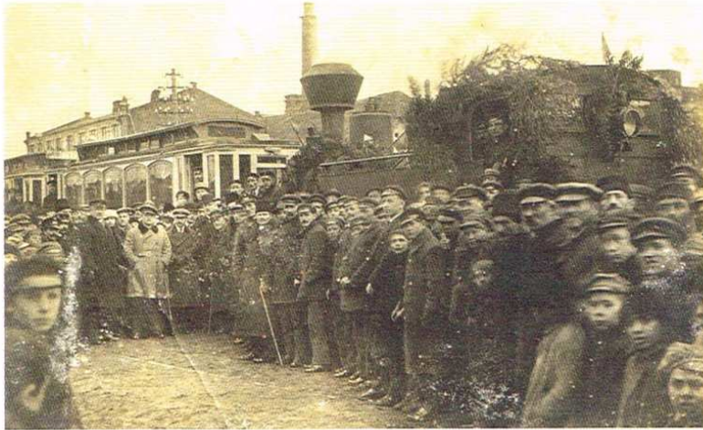
Inauguracja linii w Ozorkowie

Linia tramwajowa z Ozorkowa do Łodzi ma już 95 lat. Choć obecnie wydłużył się czas przejazdu oraz zmieniono trasę na terenie Łodzi, a także zmniejszono częstotliwość kursowania tramwaju, to jednak 46 nadal jest nieodłącznym elementem krajobrazu i historii komunikacji regionu łódzkiego, a nawet Polski. Warto zaznaczyć, że budowa linii Ozorków-Zgierz Kaliski należy do jednych z pierwszych poważnych inwestycji prywatnych powstałych przy wsparciu państwa, które znajdowało się w trudnym okresie gospodarczym po odzyskaniu niepodległości i po zakończeniu wojny polsko-bolszewickiej. Z uwagi na fakt, iż na naszej trasie kursował „tramwaj parowy” (w latach 1922-1926), to nie osiągał on zawrotnej prędkości. W owym okresie na tej linii najwolniejszym w Ozorkowie był odcinek prowadzący z Alei do obecnego Starego Cmentarza Katolickiego przy ulicy Zgierskiej. „Tramwaj parowy” minawszy Kościół Ewangelicko-Augsburski, wspinał się powoli po szynach na szczyt wzniesienia. Ponoć młodzi ludzie byli w stanie wyprzedzić tramwaj na piechotę i dojść w rejon cmentarza, zanim ten znalazł się na szczyście. Sentymentalno-wspomnieniowych relacji jest zdecydowanie więcej, pochodzą one z różnego okresu, ale warto przytoczyć jeszcze jedną.