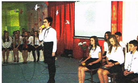
Uroczysty apel w Gimnazjum nr 1

Maryla Pankiewicz