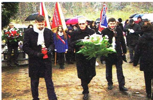
Główne uroczystości na Nowym Cmentarzu

Ojczyzna, patriotyzm, wolność – rangę i znaczenie tych słów przypomnieli uczniowie Gimnazjum nr 1 w Ozorkowie podczas uroczystego apelu, który odbył się 10 listopada, w przeddzień Święta Niepodległości.