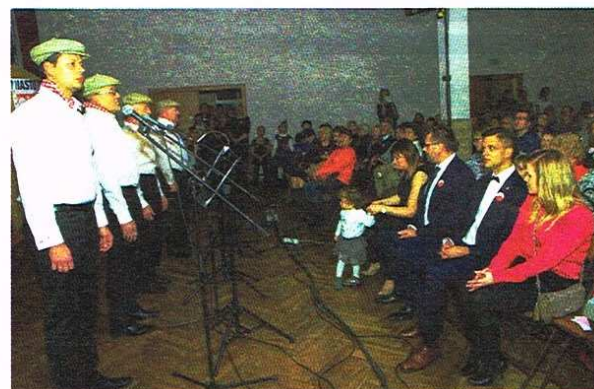
Patriotyczne Śpiewanie w MOK

I Drużyna Harcerska im. D. Siedzikówny rozpalila nasze serca pieśnią „Płonie ognisko”, zaś starsi harcerze z drużyny „Pro Patria”, „Niezłomni”, „Via Ferata” rozśpiewali widowńnię kresową balladą „Sokoły”. Wiele uśmiechu i ożywienia, szczególnie w plci pięknej, wywołali jak zwykle panowie z „Kwartetu Świętecznego”. Z wielką