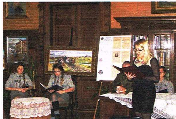
Wieczór Poezji Legionowej w MBP

Ozorków to nasze małe miejsce na ziemi. Przekonywało o tym nie tylko motto tegorocznych śpiewów, ale także wielkie zaangażowanie artystów i rozśpiewanej widowni. Szczególnego klimatu dopełniła recytacja fragmentu wiersza o Ozor-