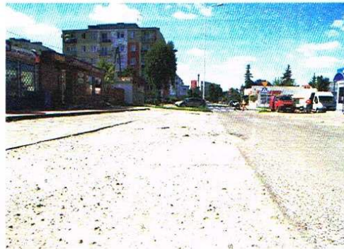
Zniszczony parking zostanie wyremontowany

Projekt dotyczy przebudowy miejsc postojowych w ul. Małachowskiego na odcinku od ul. Piłsudskiego do ul. Nowe Miasto.