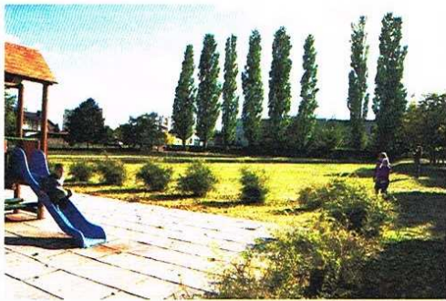
Tu powstanie teren rekreacyjny Bajkolandii

Projekt zakłada wybudowanie i wyposażenie boiska do piłki nożnej, koszykówki i siatkówki, stołu do gry w szachy, stołu do gry w tenisa stołowego, ławek oraz wykorzystanie zadrzewionego terenu do zajęć lekcyjnych i pozalekcyjnych przy Szkole Podstawowej Nr 5 przy ul. Konarskiego 2.