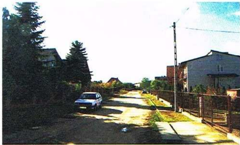
Na ul. Olczaka będzie widniej i bezpieczniej

Projekt dotyczy montażu oświetlenia na odcinku 230 m ul. Olczaka.