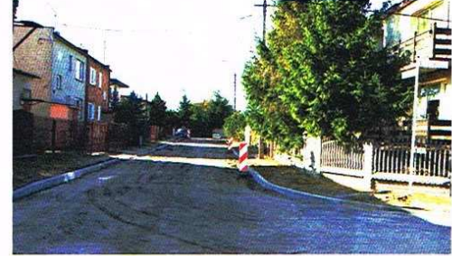
Mieszkańcy czekają na chodnik

Zadanie polega na wybudowaniu chodnika z kostki brukowej oraz miejsc postojowych.