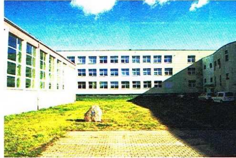
To dobre miejsce do ćwiczeń na świeżym powietrzu

Projekt dotyczy wyposażenia terenu w urządzenia do ćwiczeń na świeżym powietrzu. Siłownia służyłaby wszystkim mieszkańcom Ozorkowa.