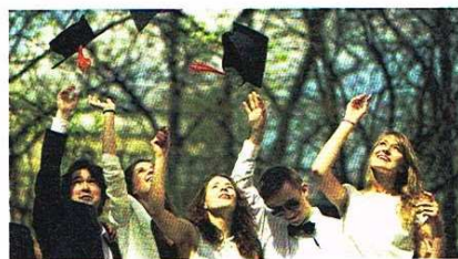
I Liceum Ogólnokształcące im. Stefana Żeromskiego w Ozorkowie

POCZUJ MOC WIEDZY ... ... DOŁĄCZ DO NAS !!!