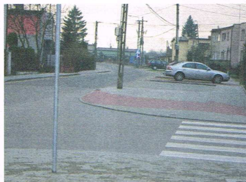
ul. Brzoskwiniowa przy ul. Malinowej

Programu Operacyjnego, realizowane w latach 2007 – 2013. W Ozorkowie w ramach tego programu wyremontowano m.in. ul. Brzoskwiniową i Malinową; jeśli wniosek o refundację zostanie zaakceptowany, a są na to duże szanse, do kasy miasta może wrócić 750 tys. zł.