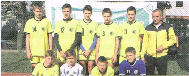
Gimnazjum nr 1

Nasi siatkarze to znakomici zawodnicy, którzy niebawem z orlików staną się prawdziwymi Orłami Sportu. Życzymy im wytrwałości i wielu sportowych sukcesów.