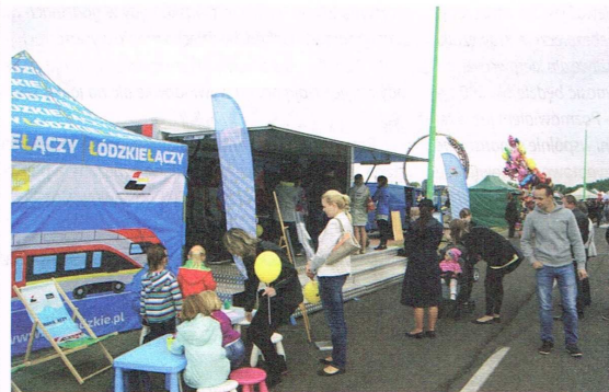
Stoisko ŁKA na Dniach Ozorkowa 2015

Pasażerowie, korzystający regularnie nie tylko z pociągów ŁKA, ale też ze składów Przewozów Regionalnych i tramwajów i autobusów m.in. w Zgierzu i Łodzi, mogą zakupić miesięczny bilet aglomeracyjny. Jego koszt to 240 zł normalny i 120 zł ulgowy. ID