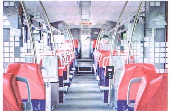
Łódzka Kolej Aglomeracyjna – wewnątrz

Mieszkańcy Ozorkowa mieli już możliwość zaznajomić się z ofertą ŁKA 23 maja 2015 r. podczas Dni Ozorkowa na stoisku mobilnym Łódzkiej Kolei Aglomeracyjnej.