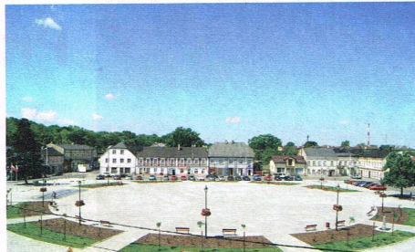
Plac Jana Pawła II – 2014 r.

Młyn na rzece oraz nieodzowna karczma przy gościńcu dopełniały funkcję małej wioski Ozorków, należącej, obok sąsiedniego, znacznie zamożniejszego Strzeblewa, do szlacheckiego rodu Szczawińskich, pieczętujących się herbem Prawdzic.