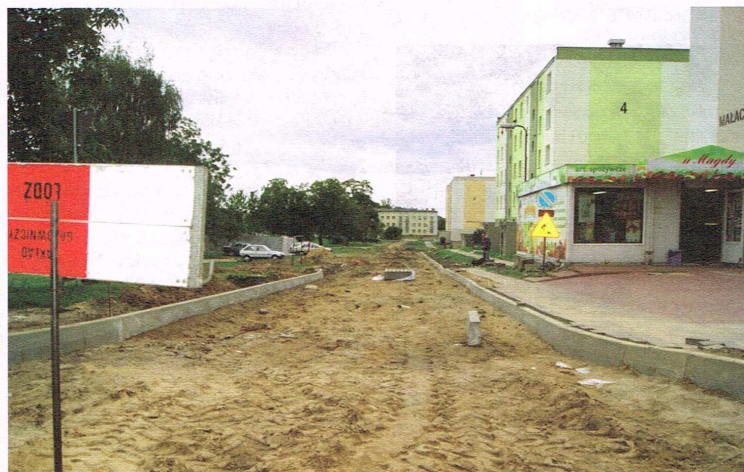
Początek prac – usunięcie starych płyt

Ulica Kołłątaja przez 25 lat pokryta była płytami betonowymi, które pozostały po budowie osiedla; korzystanie z takiej drogi było dość uciążliwe, poza tym z pewnością nie była to najlepsza wizytówka osiedla. Teraz się to zmienia. ID