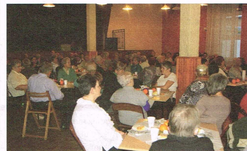
Sala przed remontem