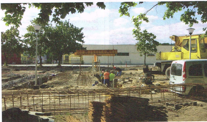
Modernizacja Targowiska Miejskiego – 2013 r.