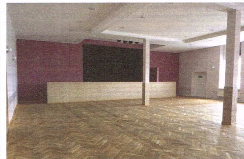
Sala po remoncie

W połowie sierpnia zakończył się remont sali widowiskowej Miejskiego Ośrodka Kultury. W ramach prac wyremontowano ścianę, przy której znajduje się scena, zamontowano podwieszany sufit, wymieniono oświetlenie na energooszczędne lampy ledowe i wykonano wentylację. Wszystkie ściany sali pojawiły odmalowano, front sceny oraz filary wyłożono płytkami imitującymi kamień, oczyszczono i odświeżono także parkiet poprzez cyklowanie i olejowanie podłogi. Koszt prac remontowych wyniósł 37,5 tys. zł.