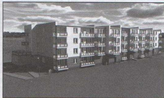
Blok przy ul. Średniej 35 - wizualizacja

W każdy wtorek, w godzinach 12.00 - 17.00 w Urzędzie Miejskim przy ul. Wigury 1 na pierwszym piętrze przy okienku nr 105 dyżuruje pracownik TBS, który odpowie na wszystkie pytania, m.in. dotyczące warunków otrzymania mieszkania, a także zasad i kosztów wykupu udziału. Można także zadzwonić pod numer telefonu 42 717 18 18, 42 710 32 34 oraz zajrzeć na stronę internetową www.tbs.zgierz.pl . ID