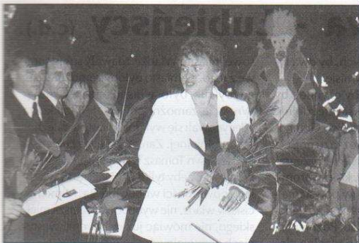
Dzień Edukacji Narodowej w Powiecie Zgierskim