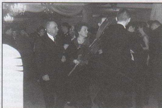
Na jednej ze studniówek