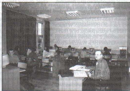
Konkursowa pracownia informatyczna