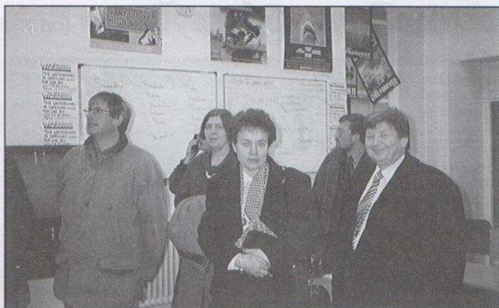
Z członkami Programu „Nowa Matura” w jednej ze szkół londyńskich