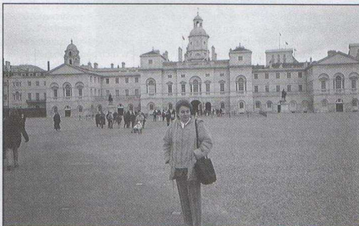
Przed Pałacem Królewskim w Londynie