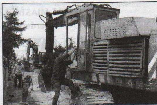
Budowa kanalizacji na ul. Średniej

Natomiast pod koniec sierpnia rozpoczęły się roboty budowlane w ulicy Praga; położono 213 metrów wodociągu i 160 m kanału sanitarnego. Wybudowano 15 przykanalików i przebudowano 14 przyłączy wodociągowych. Po zakończeniu tych prac rozpoczęła się budowa kanalizacji deszczowej, zlecona przez