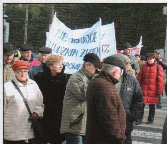
Batalia o pomoc medyczną (na stronach 3 i 4)