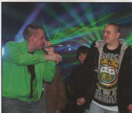
Freestylowa Bitwa - OFB 2011 (na stronach 12 i 13)