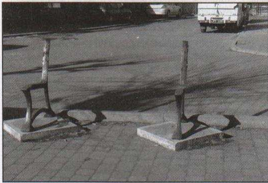
Tyle zostało z jednej z ławek przy Starzyńskiego

Zdewastowane ławki, powyrywane kosze na śmieci, uszkodzone lub wyrwane znaki drogowe - tak niestety wygląda Ozorków, zwłaszcza w niedzielę rano, po sobotnich powrotach nietrzeźwych, głównie młodych ludzi z różnego rodzaju imprez.