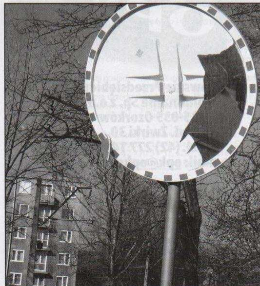
Potłuczony znak - lustro przy ulicy Nowy Rynek

Więcej szczegółów na temat instalacji monitoringu w mieście w kolejnym numerze Wiadomości Ozorkowskich . ID