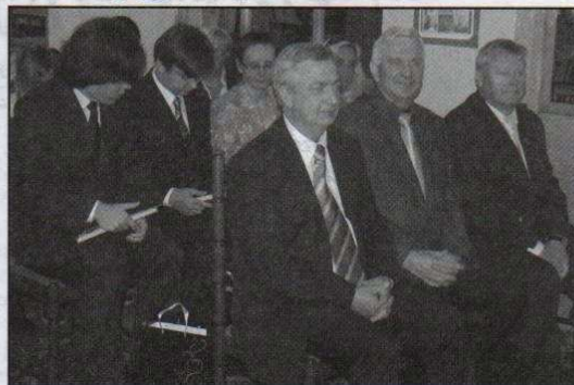
Laureaci konkursu plastycznego:

Kategoria klas I - III szkoły podstawowej: