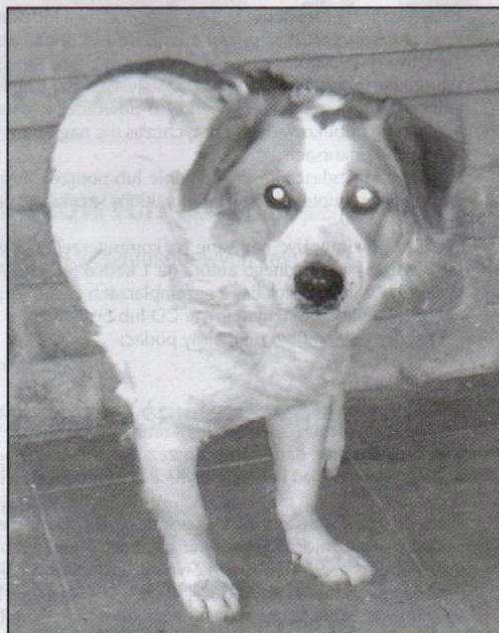
Ryży mały piesek w wieku około 2 lat, biały z rudymi uszami i łatami na głowie. Bardzo wesoły i przyjaźnie nastawiony do ludzi.