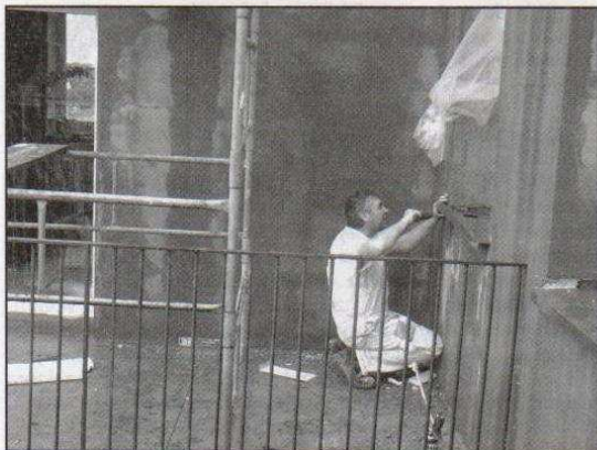
Prace w MBP przy Mielczarskiego