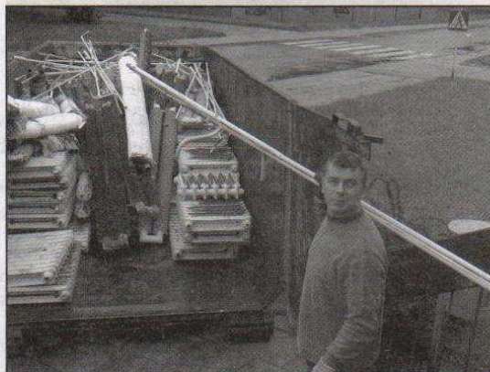
Demontaż starych kaloryferów w SP nr 5