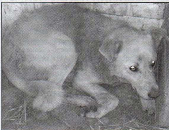
Łazęga to duży pies w wieku około 2 lat, jasno umaszczone. Jest trochę nieufny wobec ludzi i bardzo spokojny.

Przedstawiamy Państwu dwa kolejne psy czekające w schronisku „Przyjaciół” w Kotliskach (koło Kutna) na nowy dom. Więcej zdjęć psiaków oraz informacji na temat warunków adopcji znajdziecie Państwo na stronie www.umozorkow.pl w zakładce Przygarnij psiaka lub kociaka lub pod numerem tel. 0-24 356 05 42.