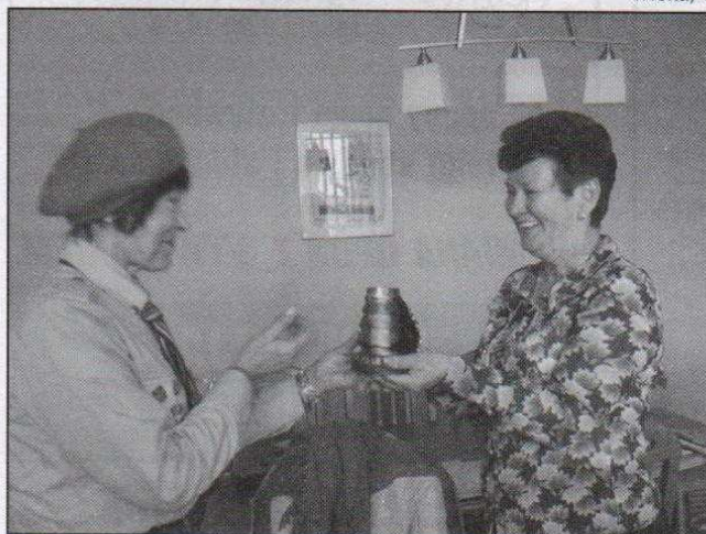
Betlejmskie Światło trafiło m.in. do PSS Społem

15 grudnia 2009 r. w archikatedrze łódzkiej ozorkowscy harcerze odebrali z rąk drużyny Komendantki Chorągwi Łódzkiej ZHP Betlejmskie Światło Pokoju rozpalone od ognia w Grocie Narodzenia Pańskiego w Betlejem.