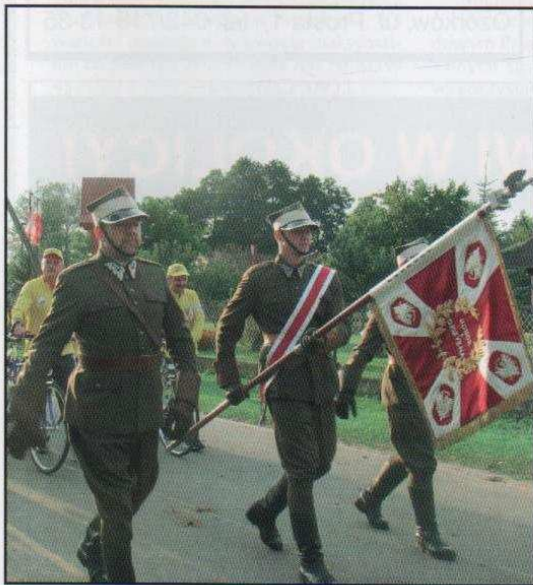
Uroczystości w Orleju (na stronie 9)