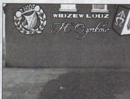
...a tak po odnowieniu przez kibiców