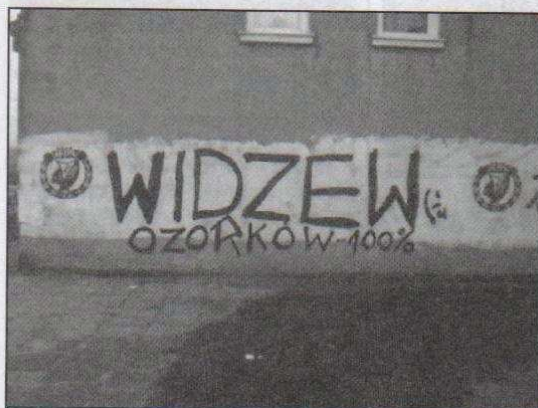
Tak ściana wygląda teraz...