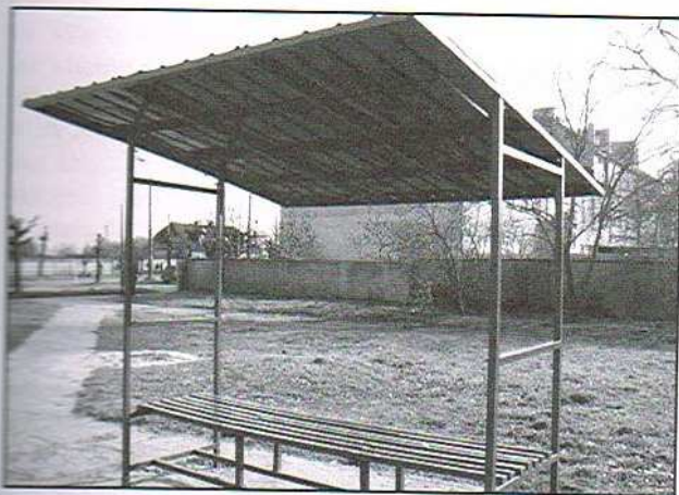
Nowy przystanek przy MOK-u

Trwają wiosenne, przedświąteczne porządki na ulicach i skwerach Ozorkowa. W ramach prac wyremontowano kilka przystanków tramwajowych i autobusowych, wymieniane są uszkodzone kosze na śmieci i dostawiane nowe, także do selektywnej zbiórki odpadów, na skwerach i wzdłuż głównych ulic już niedługo rozkwitną kwiaty i krzewy, cały czas trwa też przycinka drzew.