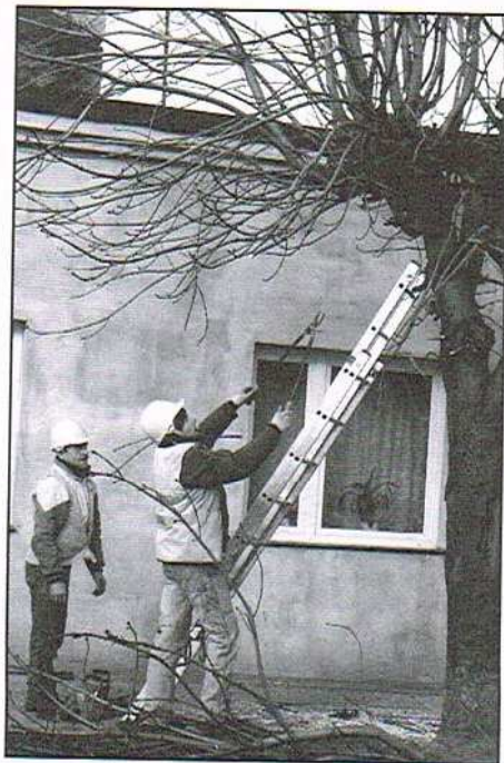
Przycinka przy ulicy Bema

Wiosną w wielu miejscach Ozorkowa zrobi się kolorowo i estetycznie dzięki klombom i rabatom kwiatowym. Kwiaty i krzewy ozdobne pojawią się na Placu Jana Pawła II (przed mapą Ozorkowa, przed flagami, zostanie zagospodarowany klomb), na Rondzie Pułaskiego, w Parku Miejskim, na skwerach przy ulicach: Żeromskiego, Traugutta, Nowy Rynek, Sienkiewicza, Łęczyckiej, a także na Starzyńskiego, w alejkach przy Wyszyńskiego i na Wigury przed Urzędem Miejskim. Miasto podpisało umowę z firmą, która projektuje zie-