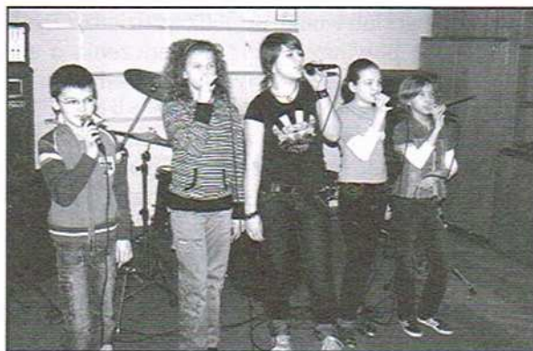
Śpiewająco w Młodzieżowym Domu Kultury