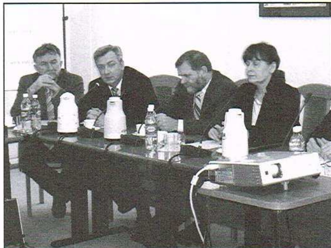
Spotkanie w łódzkim magistracie

Budowa nowoczesnej linii tramwajowej na trasie Zgierz - Łódź zagraża też istnieniu linii nr 46. Jeśli oba te miasta zre-