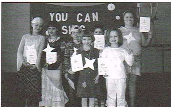
Mini Szansa na Sukces