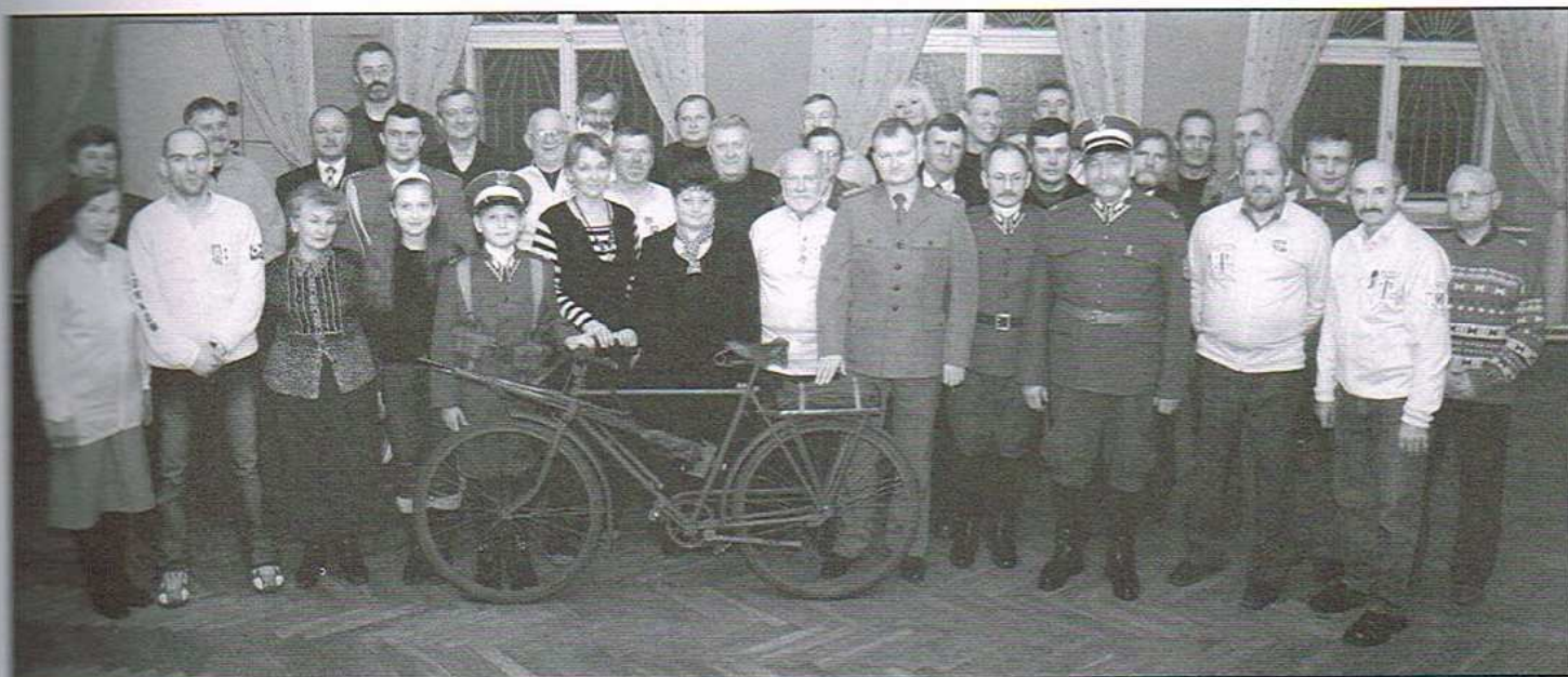
Uroczyste spotkanie „Szwadronu” i jego sympatyków