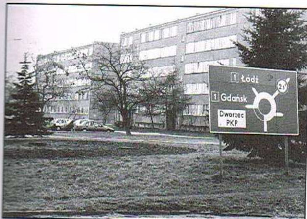
Na Rondzie Pułaskieg wkrótce będzie kolorowo