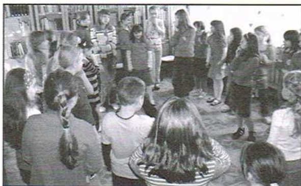
Walentynki w MBP