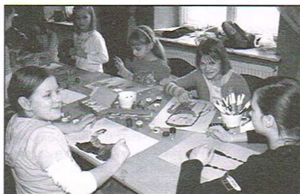
Zajęcia plastyczne w MOK-u