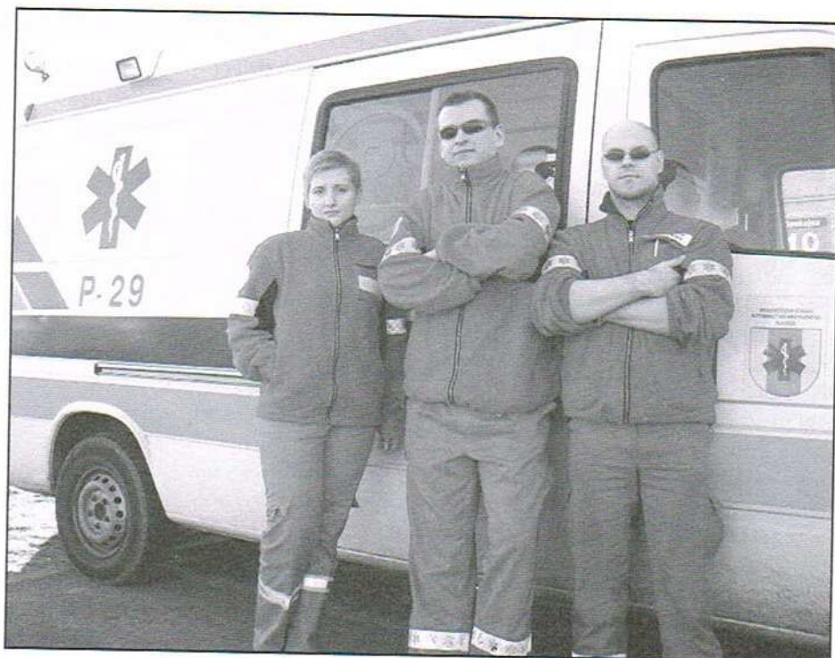
Karetka P - 29 i jej załoga