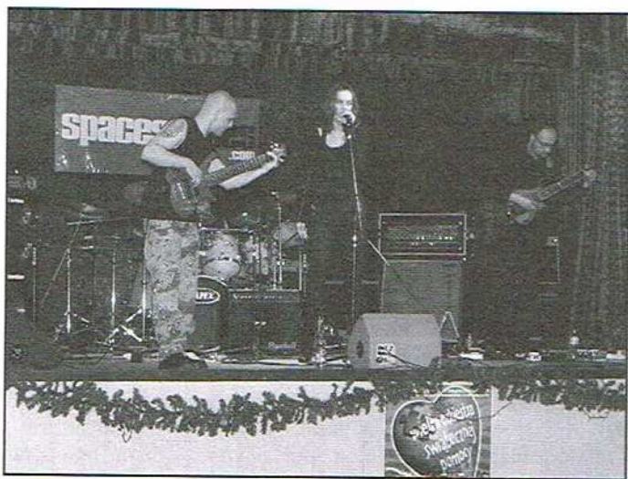
...i w MOK-u

Uwieńczeniem XVI Finału WOŚP w Ozorkowie, było, tak jak w całej Polsce,