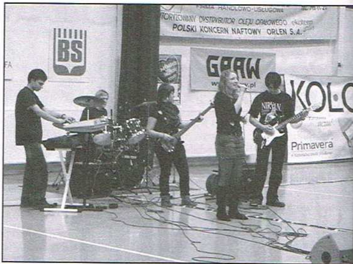
Rokowisko w Hali...

Natomiast wieczorem dorośli i młodzież bawili się na koncertach zespołów rockowych. Wystąpili: PerGibas ze Zgierz, ZWGIM Spaces Feces i Whispering. Impreza trwała do późnej nocy. Cały do-