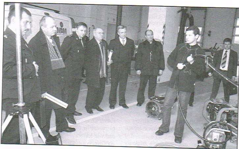
Odprawa w JRG PSP w Ozorkowie

- Jesteśmy zainteresowani tym projektem i bardzo nam zależy na jego realizacji - mówił Zastępca Komendanta Wojewódz-