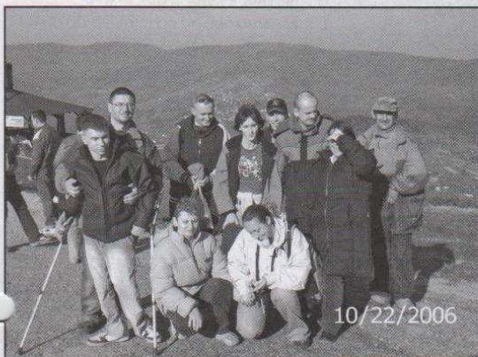
Grupa na Górze Żar