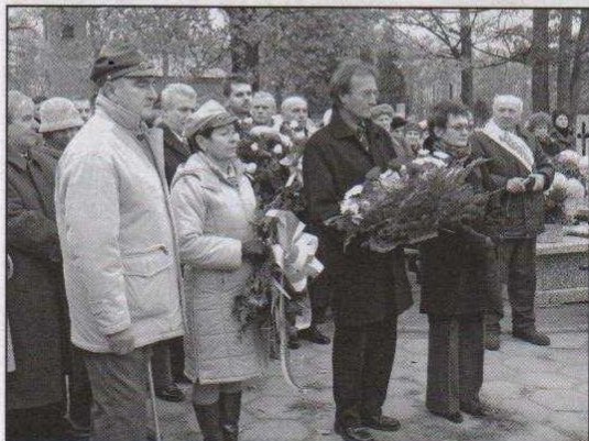
Po mszy świętej złożono kwiaty pod Krzyżem Katyńskim