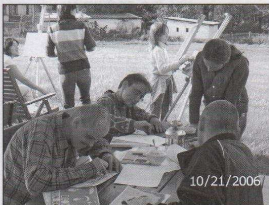
Plener malarski w Beskidzie Żywieckim