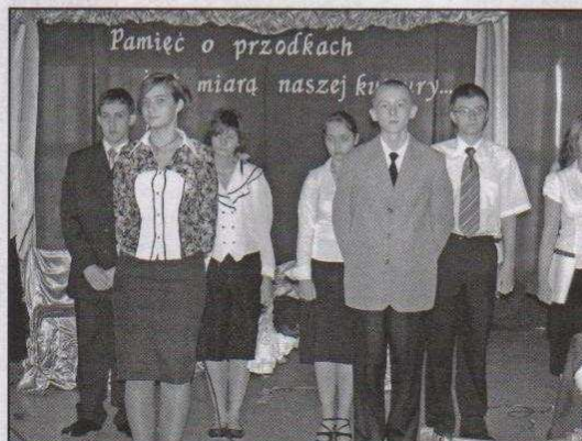
Uczniowie Gimnazjum nr 1 podczas uroczystej akademii