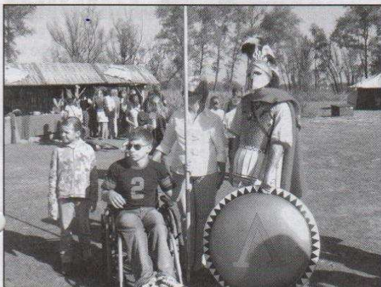
Uczestnicy WTZ wzięli udział w festynie w Biskupinie