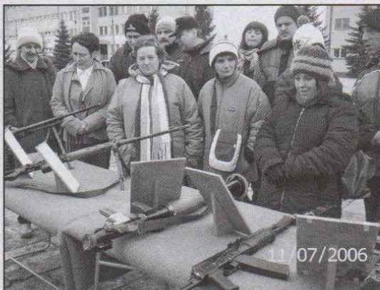
Podopieczni WTZ odwiedzili Wojsko Polskie w Leżnicy