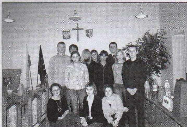
Młodzieżowa Rada Miasta w pełnym składzie