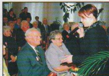
Złote gody ozorkowskich par (na stronie 10)