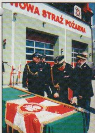
Nowa strażnica w Ozorkowie już otwarta (na stronie 7)