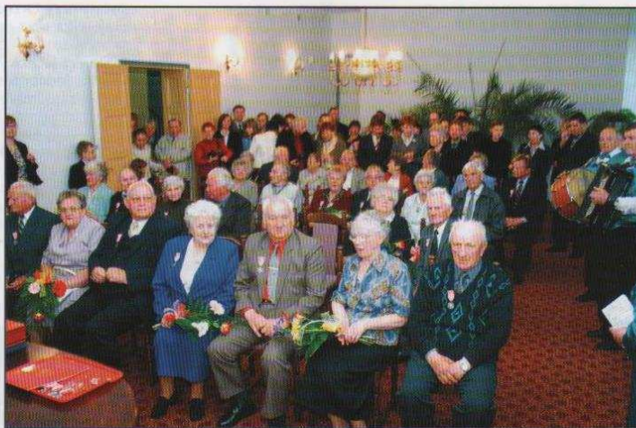
Jubilaci zrobili sobie pamiątkowe zdjęcie