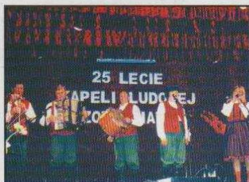
Kapela „Ozorkowianie” - ćwierć wieku razem (na stronie 3)