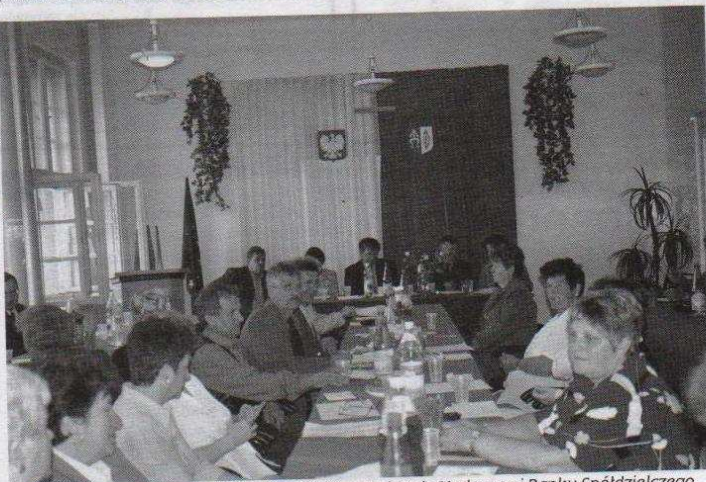
Delegaci pozytywnie ocenili działalność Zarządu i Rady Nadzorczej Banku Spółdzielczego w Ozorkowie