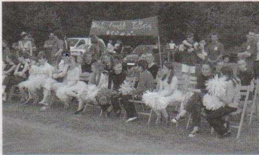
Publiczność dopingowała swoje drużyny