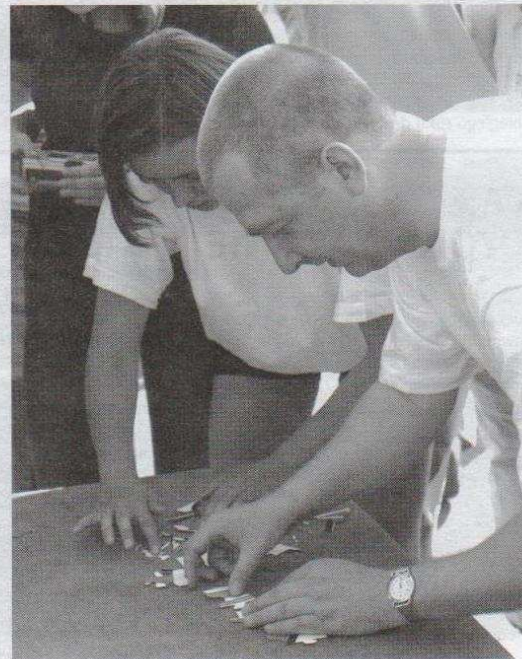
Każdy z burmistrzów musiał ułożyć herb swojego miasta z puzzli