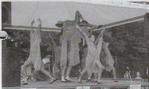
Występy niektórych drużyn były bardzo efektowne