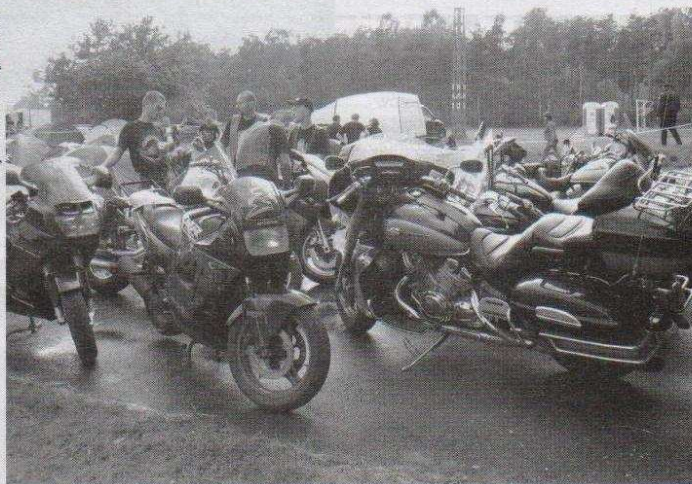
Złot odbył się tradycyjnie w Łasku Miejskim w Ozorkowie