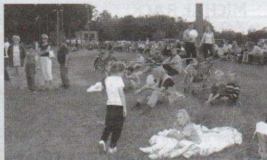
Zgromadzona na turnieju publiczność z uwagą obserwowała zmagania naszej drużyny