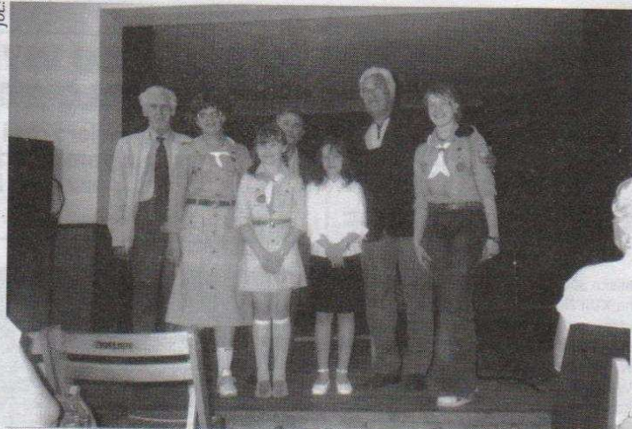
Ozorkowscy harcerze wzięli udział w obradach Koła Terenowego Związku Wyszędzonych Ziemi Łódzkiej w Ozorkowie