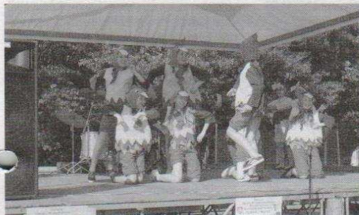
Publiczność zabawiła m.in. wesole kurczęta