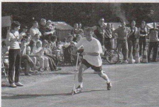
Uczestnicy Turnieju Miast musieli wykazać się umiejętnością jazdy na hulajnodze