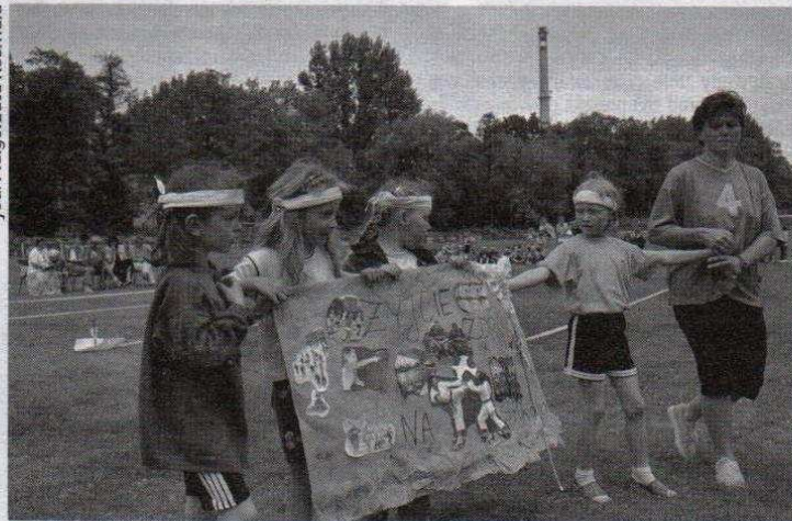
Dzieci, które uczestniczyły w spartakiadzie jako kibice miały do wykonania plakat na temat: „Sport nasz sposób na zdrowie”