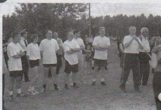
Ozorkowska drużyna w komplecie