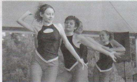
Każde z miast przygotowało krótki program artystyczny