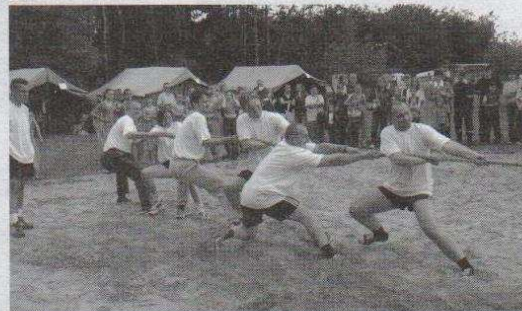
Ciągną i ciągną... oj przydałby się ktoś na przyczepkę!