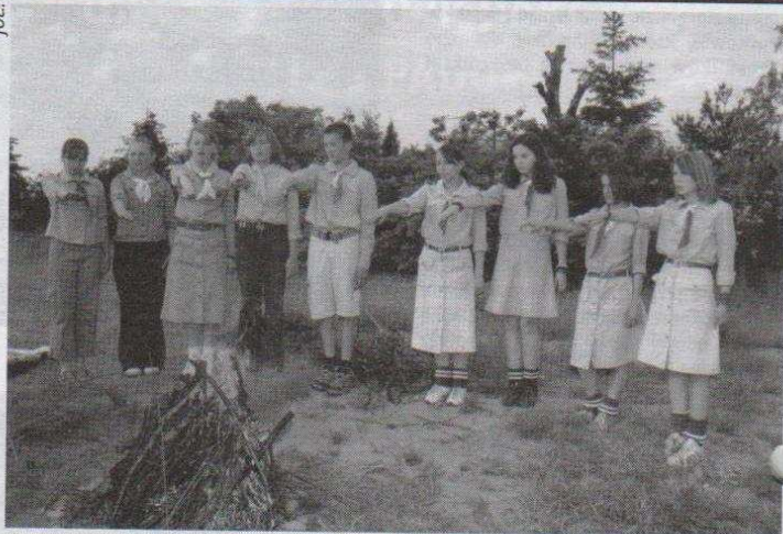
4 czerwca dziewczęciu „żółtodziobów” złożyło Przyrzeczenie Harcerskie

zakupów dla chorej instruktorki, przeprowadzali harcerski zwiad, zbierali materiały do ułożenia insygniów harcerskich i śpiewali harcerskie piosenki. Aż wreszcie dotarli na miejsce zbiórki. Tutaj harcerki starsze zobowiązały się „swoją postawą i pracą, jak najlepiej służyć Ojczyźnie i świadom odpowiadać za wychowanie powierzonych młodzieży...”, a „żółtodzioby” przyrzekały „...pełnić służbę Bogu i Polsce, nieść pomoc bliźnim i być posłusznym Prawu Harcerskiemu...”.