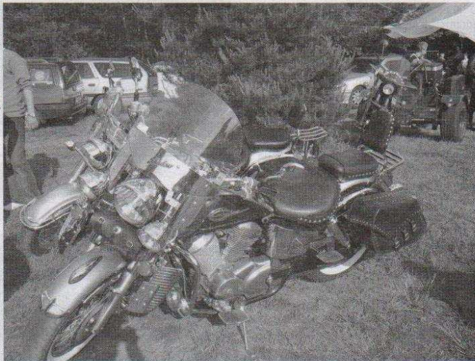
Okazałe motocykle były ozdobą zlotu