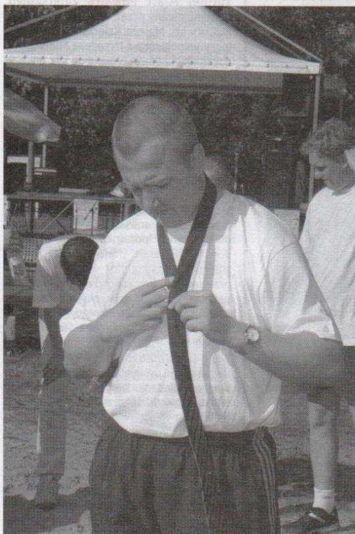
Jedną z konkurencji przygotowanych przez organizatorów dla burmistrzów miast było wiązanie krawatów