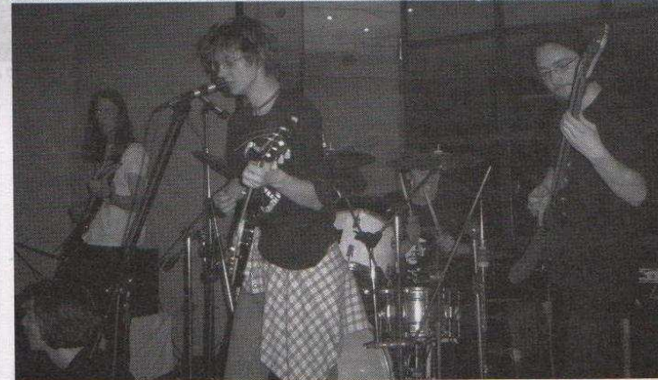
Na koncercie w „Tamadzie” wystąpiły ozorkowskie kapele działające przy MDK-u