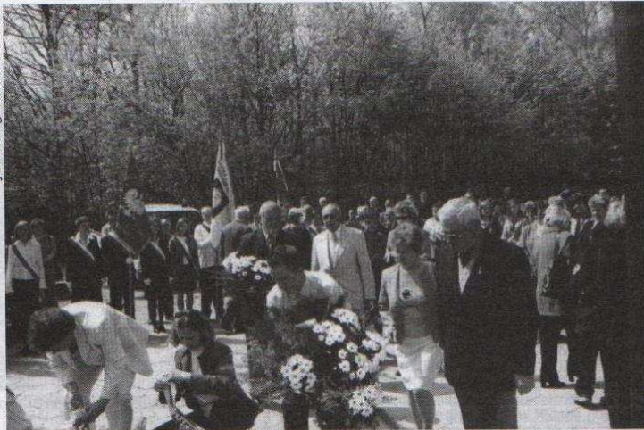
Kwiaty pod Krzyżem Katyńskim złożyli przedstawiciele instytucji z terenu Ozorkowa