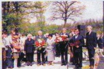
Ozorkowskie obchody 203 rocznicy Konstytucji 3-go Maja (na stronie 9)