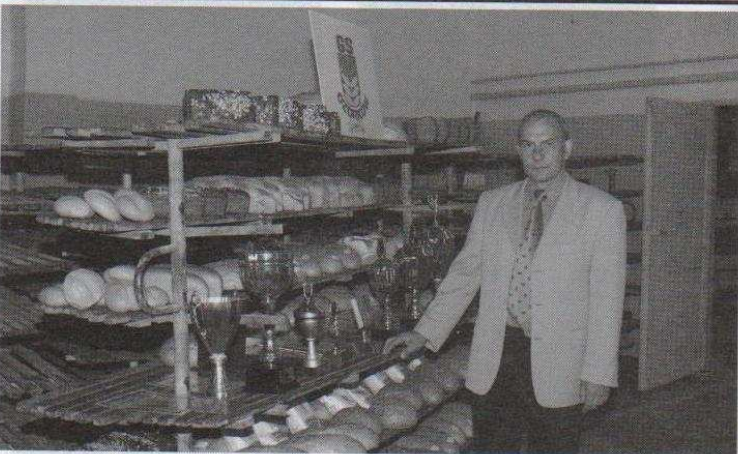
Prezes GS-u w Ozorkowie prezentuje puchary zdobyte przez piekarnię w ostatnich latach

nazjum. Szybka termomodernizacja budynku jest niezbędna ze względu m.in. na bardzo niskie temperatury panujące w placówce w okresie zimowym.