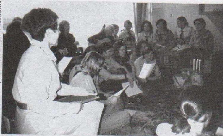
Od kwietnia zbiórki ozorkowskich harcerzy odbywają się w Gimnazjum Miejskim