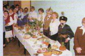
Wielkanoc w MOK-u (na stronie 10)