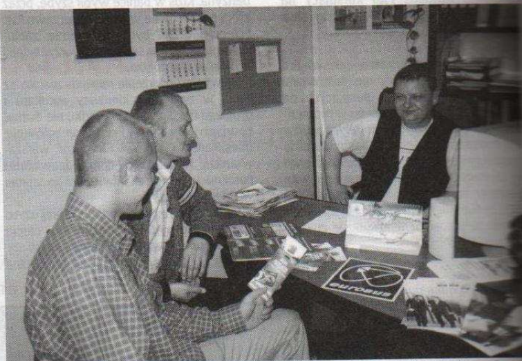
Dużym zainteresowaniem Klientów biura podróży „Jawa Tours” w Ozorkowie cieszą się ostatnio przejazdy autobusowe i przeloty do Anglii