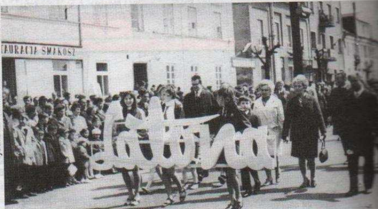
Na wystawie w ozorkowskiej bibliotece przy ulicy Listopadowej znalazło się m.in. wiele przedmiotów przedstawiających przebieg pierwszomajowych świąt w naszym mieście