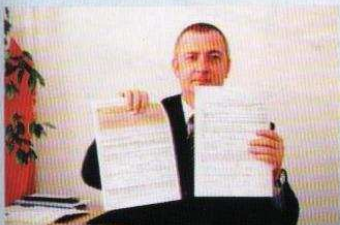
Burmistrz ujawnia „Wiadomościom Ozorkowskim” szczegóły oświadczenia majątkowego (na stronie 4)