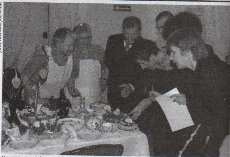
Komisja oceniająca wielkanocne stoły miała trudny orzech do zgryzienia przy wyborze zwycięzcy konkursu