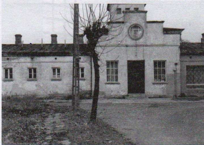
Dotychczasowa lokalizacja ozorkowskiego hufca jest jedną z przeszkód w jego dalszym funkcjonowaniu