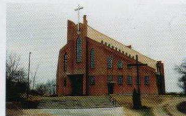
Budowa kościoła na Adamówku dobięta końca (na stronie 3)