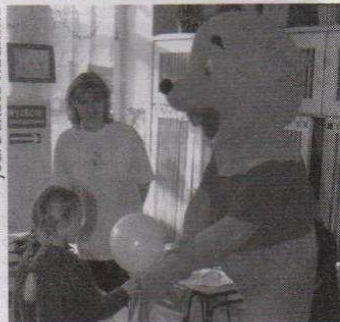
Ozorkowskie dzieci obchodziły Światowy Dzień Misia