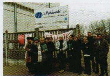
Strajk w „Mańkowskim” (na stronie 3)

ZDROWYCH I POGODNYCH ŚWIĄT BOŻEGO NARODZENIA ORAZ SZCZĘŚLIWEGO NOWEGO ROKU ŻYCZĄ: BURMISTRZ OZORKOWA, RADA MIEJSKA I REDAKCJA „WIADOMOŚCI OZORKOWSKICH”