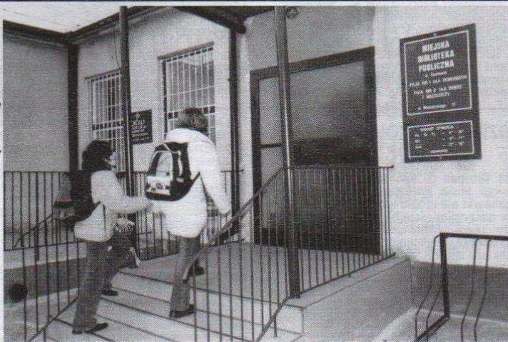
Wejście do biblioteki przy ulicy Mielczarskiego zostało zmodernizowane