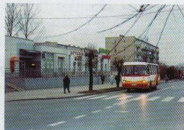
Autobusowych problemów ciąg dalszy (na stronie 5)