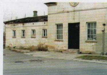
Problemy ozorkowskich harcerzy (na stronie 4)