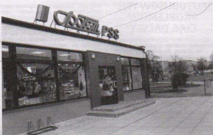
Pawilon PSS „Społem” po remoncie wygląda bardzo efektownie

wania dobrych tradycji naszej spółdzielni, uwzględniając przy tym prawa lokalnego rynku.