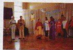
„Dzień Europejczyka” w Zespole Szkół Zawodowych (na stronie 12)