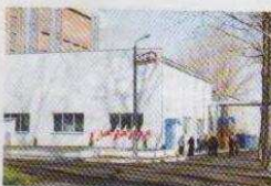
Oficjalne otwarcie nowej ciepłowni (na stronie 6)