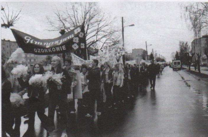
Nawet deszcz nie popsul humorów uczestnikom parady