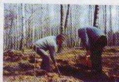
Leśna akcja ozorkowskich samorządowców (na stronie 11)