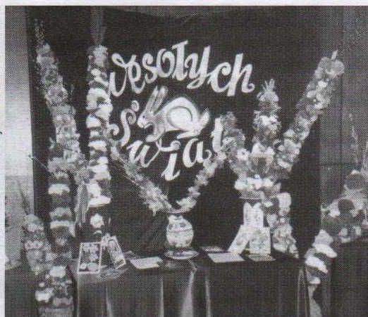
Najpiękniejsze wielkanocne palmy, kartki i pisanki prezentowano na wystawie w MOK-u