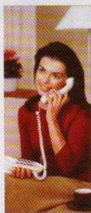
wybrane numery TP