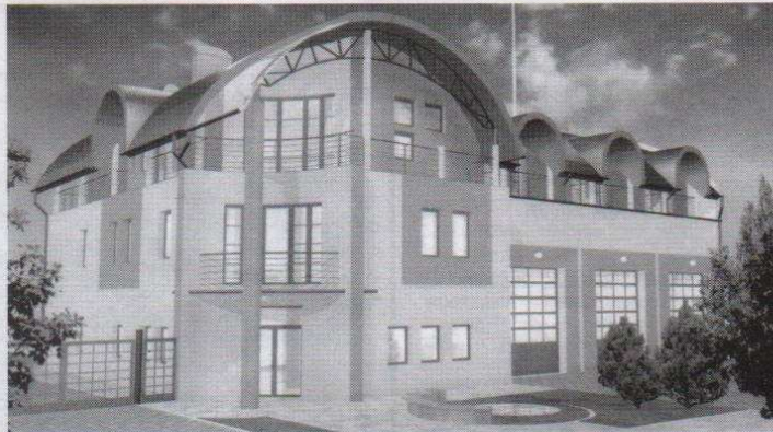
Tak wyglądać będzie nowy budynek straży pożarnej.