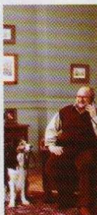
rozmowy za pół ceny TP