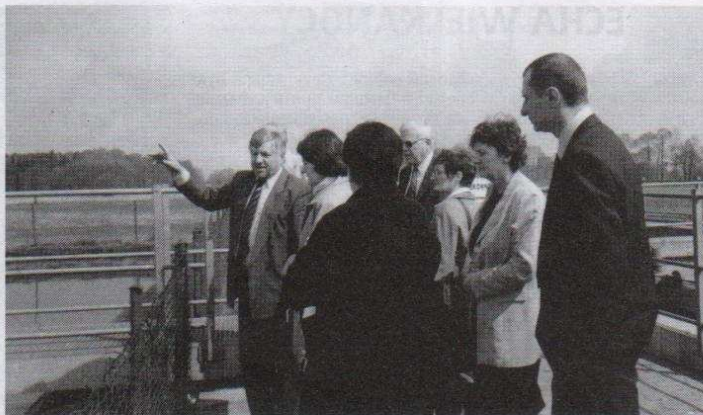
Radni zwiedzili m. in. oczyszczalnię ścieków w Cedrowicach, zarządzaną przez Ozorkowskie Przedsiębiorstwo Komunalne

IX sesja Rady Miejskiej w Ozorkowie, która odbyła się 24 kwietnia była po części