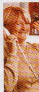
rozmowy z rabatem TP

40 pierwszych połączeń międzymiastowych w miesiącu opłata miesięczna - 6 zł