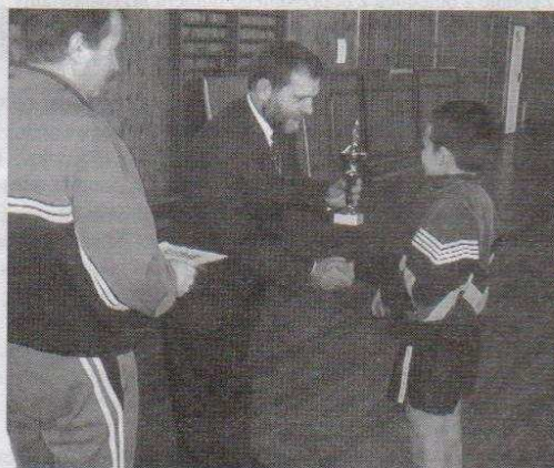
Zwycięzcy odbierają puchary z rąk zastępcy Burmistrza Miasta Ozorkowa