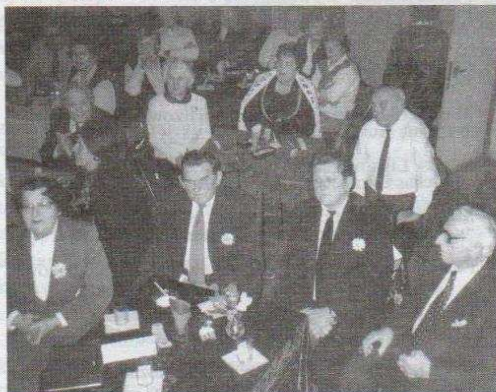
Na benefis „Okularka” przyszło wielu mieszkańców Ozorkowa