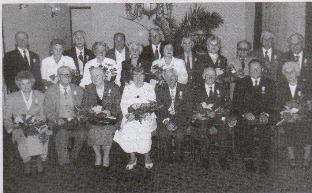
Złoci Jubilaci i władze miasta.