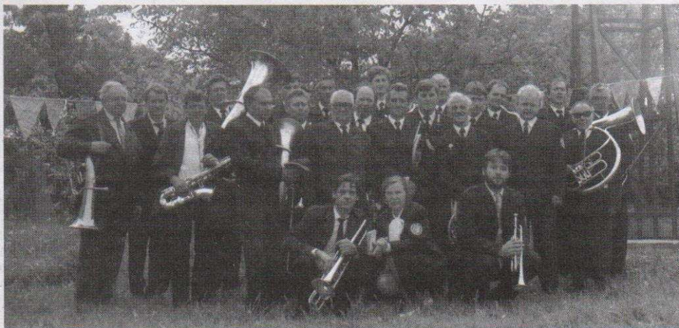
Rok 1998. Orkiestra Dęta po uroczystościach Bożego Ciała w parafii Najświętszej Marii Panny Królowej Polski na Adamówku.

Gdyby ktoś chciał grać w zespole lub był w posiadaniu dokładniejszych informacji i zdjęć naszej orkiestry a chciałby nimi się podzielić proszę o kontakt tel.: 718 -37- 74