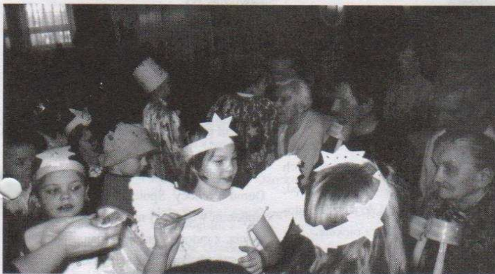
Dzieci rozdają laurki.

Przedszkolaki pamiętały również o zbliżającym się Świącie Babci i Dziadka, wszystkim starszym osobom wręczyły okolicznościową laurkę. Oprócz życzeń były piosenki, wiersze, a dla wszystkich mieszkańców D. P. S. młodsze dzieci wykonały bibulkowe słoneczko z hasłem: „Byście zawsze byli uśmiechnięci i radośni”. (Jak widać przedszkolaki robią co mogą, żeby dać radość innym).