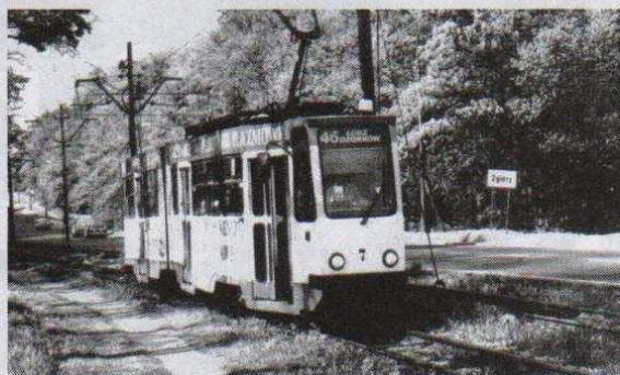
Dojeżdżamy do Łodzi.