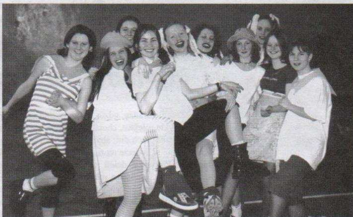
Pożegnanie karnawału w SP Nr 2.

Jedno nas tylko martwi. Szkoła Podstawowa nr 2 przestanie niedługo istnieć. W tym miejscu będzie Gimnazjum, które na pewno podtrzyma wspaniałą tradycję naszej 'dwójki', szkoły, która pozostawiła trwałe ślad w historii naszego miasta,