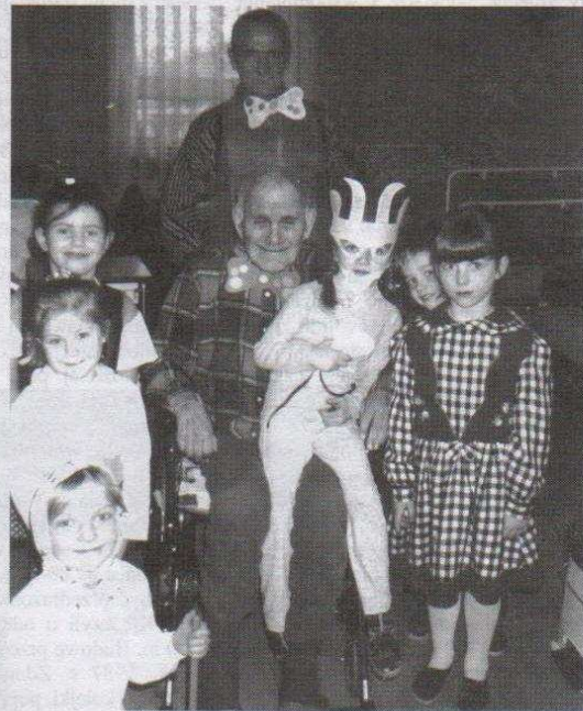
Szczęśliwi „Dziadkowie” z „wnuczkami”.

W Dniu Babci i Dziadka w DPS-ie było bardzo wesoło, a w oczach sędziwych i schorowanych ludzi pojawiły się nawet łzy radości, również dzięki uczniom Szkoły Podstawowej Nr 2 i gimnazjalistom.