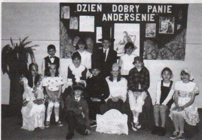
Uczniowie SP Nr 2 jako bohaterowie baśni H.Ch.Andersena.

Sala gimnastyczna pełna zaciekawionych twarzy, co chwila rozlegają się huczne brawa, słychać znane filmowe przeboje. Na środek parkietu wybiegają przebrane za sławnych aktorów postaci. Ruch, muzyka, gwar i śmiech. Nikt się nie nudzi, nikt nie wychodzi, wszyscy doskonale się bawią. Nikomu nawet nie przyjdzie do głowy, aby szukać innych wrażeń. Tym razem zorganizowano wybory miss gimnazjum. Możemy podziwiać urodę, wdzięk i grację kandydatek na najpiękniejszą, posłuchać muzyki, popatrzeć na ciekawe układy taneczne. W przerwach między pokazami prezentują się nauczyciele w „wideoklipach” do przebojów filmowych. Wszystko na wesoło, we wspaniałym tempie. Zobaczyliśmy czterech pancernych i psa (asy mops), Pana Kleksa i jego Akademię, Killera, Małego Rycerza z „Pana Wołodyjowskiego”, kłótnię Tadeusza z Telimeną, wojnę domową, dumkę na dwa serca, Charliego Chaplina. Nawet przy kołysance nikomu nie chciało się spać. Huczne brawa nie pozostawiały wątpliwości, że podobalo się i to bardzo. Najpiękniejsze dziewczęta zostały nagrodzone i jury zakończyło swoją pracę. Na parkiet wyszli wszyscy uczestnicy i taneczny korowód przetoczył się po sali.