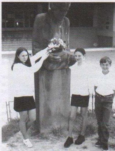
Uczniowie SP Nr 2 składają kwiaty w rocznicę urodzin Patronki Szkoły.