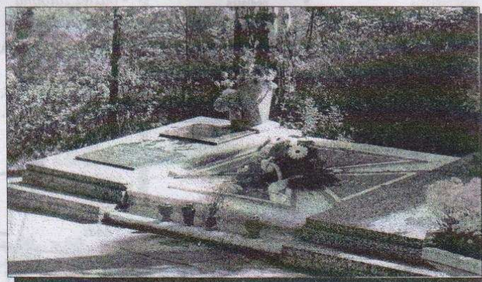
Na cmentarzu w Ozorkowie

Z okazji Dnia Zwycięstwa delegacja Związku Kombatanów RP i Byłych Więźniów Politycznych w Ozorkowie odwiedziła cmentarze w Solcy Wielkiej, Ozorkowie i Modłej. Przedstawiciele związku złożyli wiązanki kwiatów i zapalili znicze na pomnikach upamiętniających żołnierzy poległych w Bitwie nad Bzurą w 1939 roku.