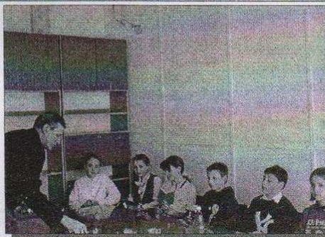
Dzieci z SP Nr 2 na spotkaniu z Z-cą Burmistrza

Uczniowie klas czwartych i piątych Szkoły Podstawowej Nr 2 w Ozorkowie im. Marii Konopnickiej biorą udział w konkursie Programu Plusssza „3-majmy się zdrowo”.