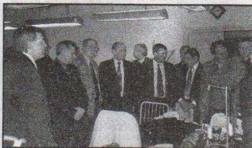
W jednej z firm w Inkubatorze

Tematem wizyty było zapoznanie się przedstawicieli Republiki Białoruś z zasadami funkcjonowania inkubatora, jego roli w przeciwdziałaniu bezrobociu, pomocy w tworzeniu i funkcjonowaniu firm oraz możliwości adaptacji