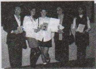
Laurentki konkursu z nauczycielkami

Ogłoszony w styczniu br. I Wojewódzki Konkurs Poetycki im. K.K. Baczyńskiego na zestaw 3 wierszy na dowolny temat został rozstrzygnięty 19 listopada.