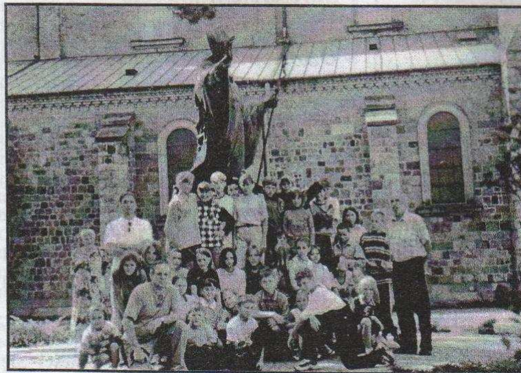
Katedra w Plocku, 6 sierpnia 1998