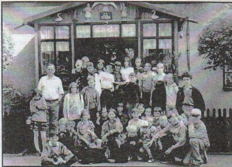
Sromów, 29 lipca 1998