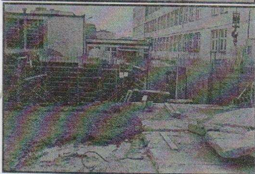
Prawie wiosenna pogoda pozwala na kontynuowanie prac przy budowie basenu.