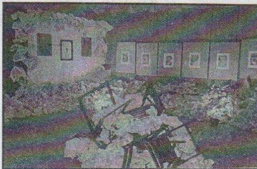
Instalacja z krzeseł i gazet