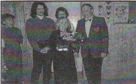
1 rocznica istnienia gazetki "Nasz Dom"

Miła uroczystość miała miejsce w walentynkową sobotę (14.02. br.) w Państwowym Domu Pomocy Społecznej przy ul. A. Mickiewicza 1 w Ozorkowie. Były kwiaty, upominki, tort, a nawet kieliszek szampana. Okazją ku temu była pierwsza rocznica wydawania w tym Domu gazetki pod nazwą "Nasz Dom".