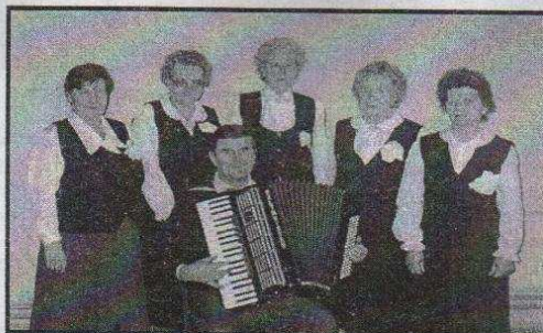
Zespół "Pogodna Jesień"