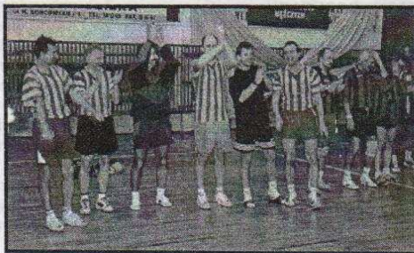
Z zajęcia II miejsca również można się cieszyć- zespół TKKF 2 Ozorków

W godzinach od 14.00 - 20.00 w sportowej atmosferze trwała walka na dwóch boiskach w Hali. Po ciężkim finałowym meczu, zwycięstwo nad zespołem TKKF 2 Ozorków odnieśli siatkarze z JW Leźnica 2 : 1. Pozostała kolejność była następująca: III miejsce TKKF Wieluń; IV miejsce ZPB S.A. "Morfeo"; V miejsce Zawodowa Straż Pożarna; VI miejsce Ozorkowska Spółdzielnia Mieszkaniowa; VII miejsce Policja. MAK