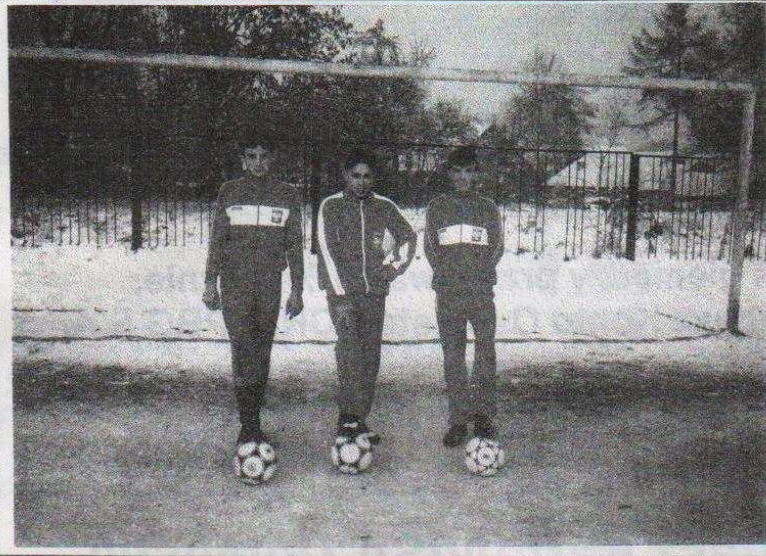
Reprezentanci Polski po treningu