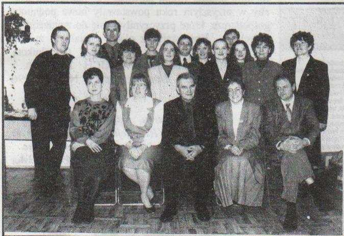
Uczestnicy i organizatorzy kursu