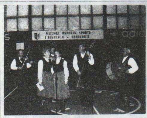
Kapela "Ozorkowianie" na obchodach swojego święta

Pierwszy konkursowy występ - na Wojewódzkim Przeglądzie Twórczości Ludowej w 1984 roku - przyniósł kapeli wyróżnienie. Od tego też roku mecenat nad zespołem objął i sprawuje do dziś Miejski Ośrodek Kultury w Ozorkowie.