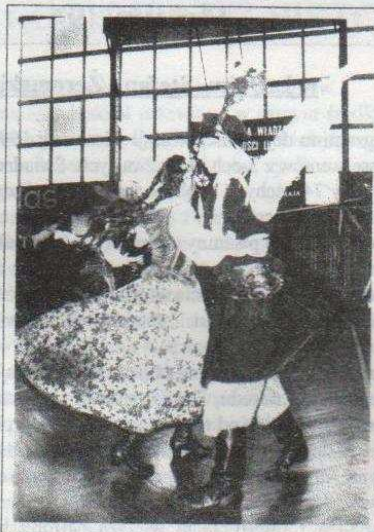
Występy w Hali Sportowej MOSiR-u