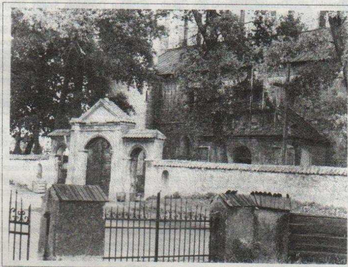
Kolegiata w Tumię

Bywali chętnie w łączycyckim grodzie: biskup Oleśnicki,