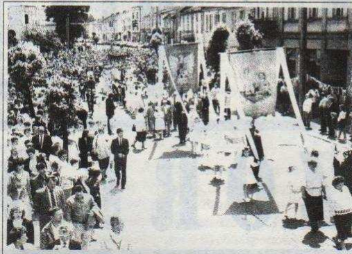
Procesja na ulicy Listopadowej