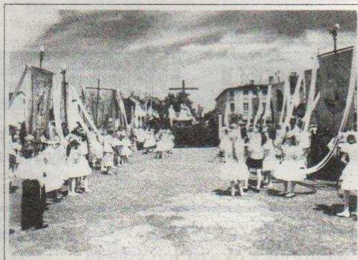
Ółtarz na Placu Jana Pawła II