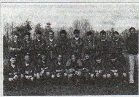
Piłkarze „Bzury” przed pierwszym meczem nowego sezonu

Przed sezonem piłkarskim odwiedziłem drużynę seniorów ozorkowskiej Bzury . Wszyscy byli w dobrych humorach po wygranym meczu Pucharu Polski przeciwko drugiemu zespołowi Orla Parzęczew. Mecz ten odbył się 23.03.1994 w