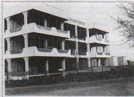
fol. G. Skonieczko

1-kredyty bankowe niespłacone wg stanu na dzień 27.05.1990 r. - 340