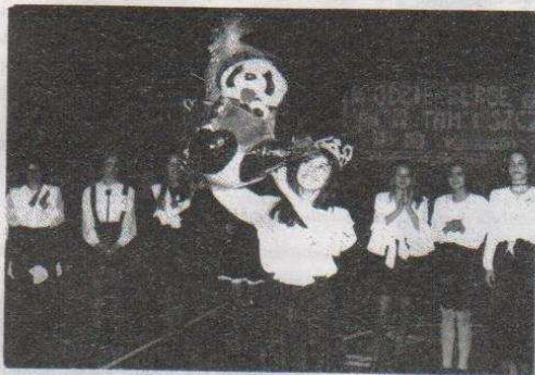
"Miss Nastolatek '94".

5 marca w Hali Sportowej w Ozorkowie odbył się "Wielki Show Dziecięcy", w trakcie którego wybierano