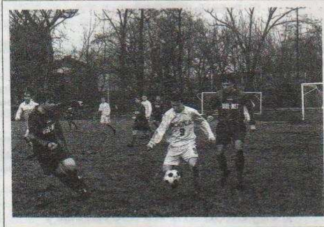
Mecz z LZS Różyca

"Wiadomości Ozorkowskie" - Pismo Zarządu Miasta Redaktor Naczelny: Eugeniusz Rosiak, Sekretarz Redakcji: Nina Pogorzelska, Redakcja sportowa: Bogdan Lewandowski, Serwis fotograficzny: Grzegorz Skonieczko Ministerstwo prosimy nadysłać na adres: Biuro Rady Miejskiej - Ozorków, ul. Wigury 1 z dopiskiem "Wiadomości Ozorkowskie". Redakcja zastrzega sobie prawo opracowania redakcyjnego teksta i korektury. Materiałów nie zamówionych nie odbieramy. Za treść ogłoszeń redakcja nie odpowiada. Dział komputerowy: S.C. HORUS Ozorków, ul. Listopadowa 9a Druk: Inkubator Przędzielnictwa Ozorków, ul. Listopadowa 9A