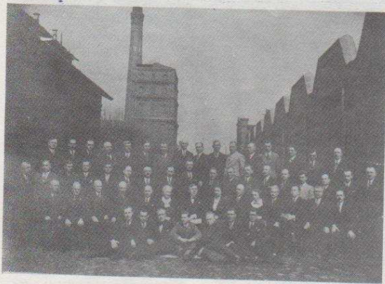
Pierwsza fabryka Fryderyka Schössera z roku 1823.

stawie w wieku XV i XVI stał młyn poruszany przez dwa koła młyńskie, osadzone na dwóch końcach długiego wału. Od stawu Piła odchodziły dwa koryta rzeki Bzury. Trzecie, wąskie koryto w postaci rowu, służyło jako upust dodat-