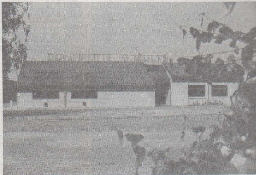
Macierzysta firma „BULTÉ” w Waarschoot w Belgii.

W.O.: Jak oceniana jest jakość wyrobów ozorkowskiej „Buki”?